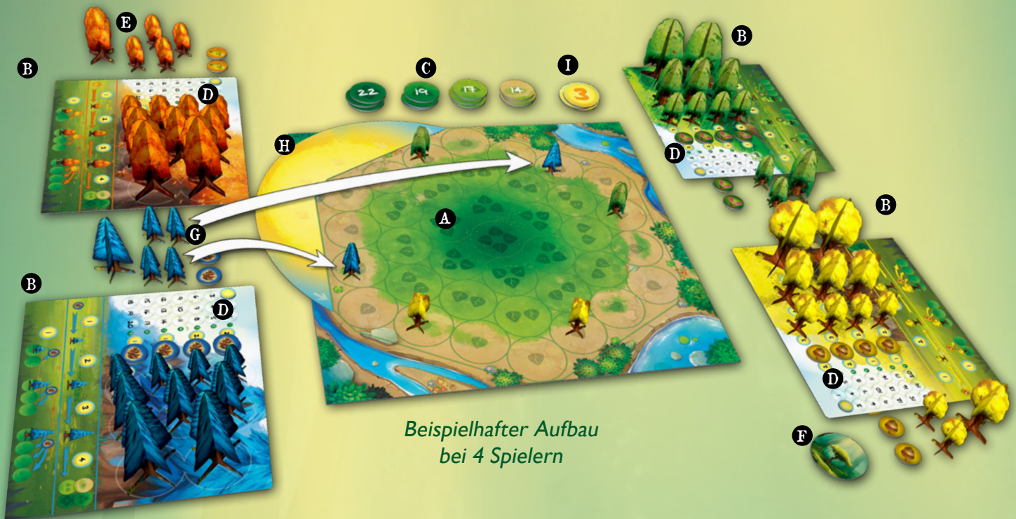
Beispielhafter Aufbau bei 4 Spielern