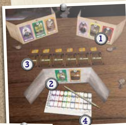
Beispiel für die Spielvorbereitung bei 3 Spielern

3 In der Tischmitte werden alle übrigen Karten verdeckt in einer Reihe ausgelegt: Diese Karten sind die geheimen Informanten-Karten . Ordne jeder Karte einen Buchstaben zu, angefangen mit A. Alle nicht benötigten Buchstaben kannst du zurück in die Schachtel legen.