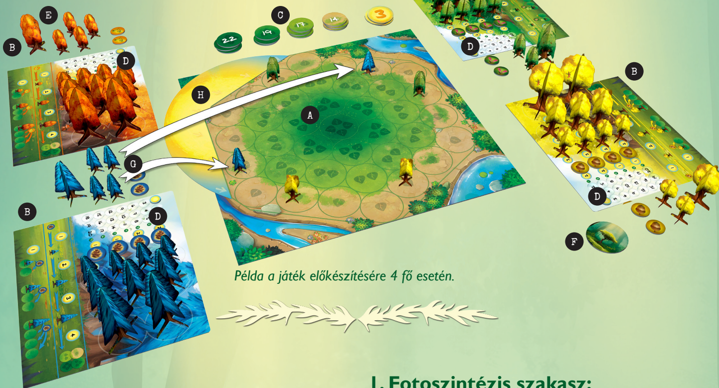
Példa a játék előkészítésére 4 fő esetén.

Két játékos esetén: a három legsötétebb pontozókorongot (aminek 4 levél van a hátoldalán), tegyétek vissza a dobozba, ezek nem kerülnek játékba. Ha a játékosok az erdő közepén lévő mezők után gyűjtenének pontot, a háromleves toronyból kapnak korongot.